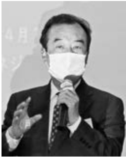
激励する屋宮理事長