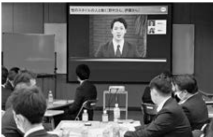
相手のタイプを探る訓練も実施