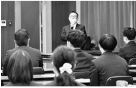
激励する藤巻委員長