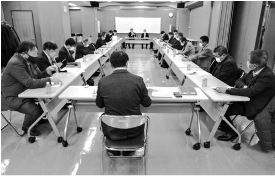
1月度理事会を開催した

東京都電機卸商業協同組合（TEP）は1月25日、1月度TEP理事会を全国家電会館で開催した。