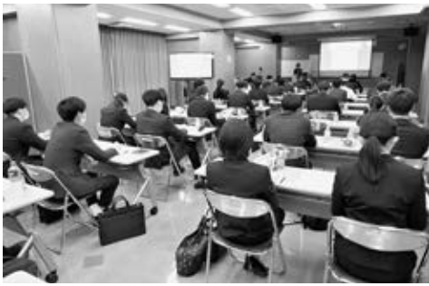
ストレスチェックなども学んだ