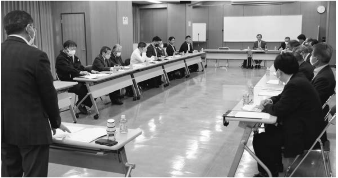
4月度理事会ではすべての議題を承認