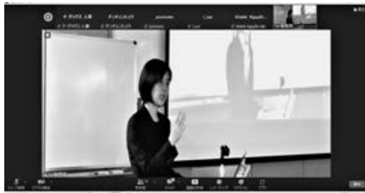
オンラインでも多数が参加した

また今回の研修では、初の試みとしてストレスについても研修が行われ、ストレスとはどんなものなのか、ストレスを軽くするチェックポイント、ストレス耐性を高める生活習慣についても学んだ。