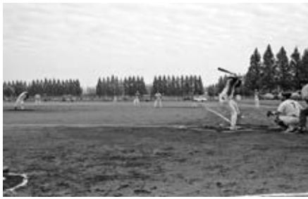
第107回野球大会の結果も報告