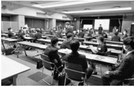
グループワークを行う参加者たち