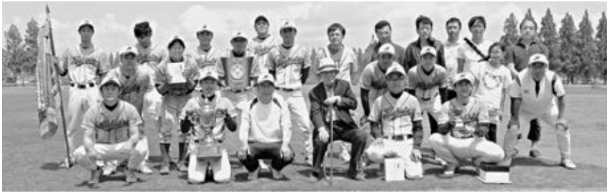
優勝した角田チーム、応援団も大活躍