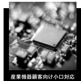
産業機器顧客向け小口対応