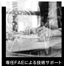
専任FAEによる技術サポート