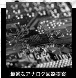
最適なアナログ回路提案