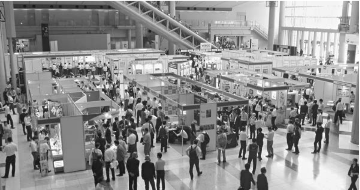
大盛況のJEP/TEPショーの会場